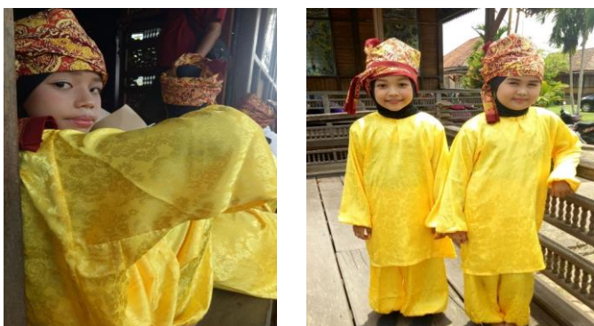
Gambar 3. Baju Kurung Anak Melayu Jambi

Demikianlah filosofi yang dimaknai pada baju kurung perempuan melayu Jambi, seperti yang dituturkan oleh kepala museum Siginjau Jambi. (wawancara, Kota Jambi, 2 Juli 2020).