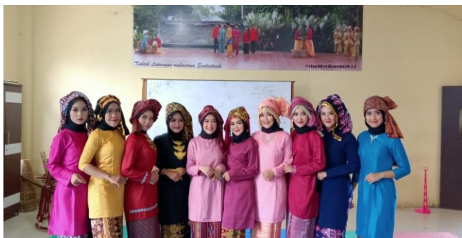
Gambar 4. Baju Kurung Perempuan Melayu Jambi Lengkap dengan Aksesoris

Jika dahulu pakaian hanya berfungsi sebagai alat pembungkus atau pembalut yang melindungi tubuh dari udara dingin maupun udara panas atau pun gigitan serangga, maka dengan perkembangan Islam di tanah melayu, baju kurung tradisional perempuan melayu Jambi bukan lagi hanya berfungsi sekadar membalut aurat secara adat tapi juga membungkus aurat sesuai dengan etika dan estetika dalam adat dan agama Islam. Dimana terdapat aturan-aturan dalam kaidah berpakaian secara etika dan estetika yaitu harus longgar tidak memperlihatkan lekuk tubuh perempuan yang menjadi aurat, bentuk lurus kebawah, tangan bersiba dan bahan yang digunakan juga harus nyaman dan tidak transparan, hingga tidak membatasi gerak aktivitas perempuan melayu. Secara estetika juga tetap terlihat indah dan anggun.