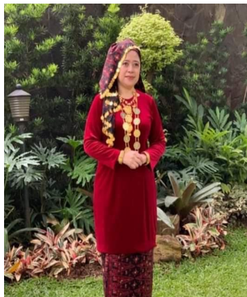
Gambar 5. Pakaian Adat Tradisional Perempuan Melayu Jambi

Saat ini perkembangan pakaian perempuan melayu terus berkembang sesuai dengan perkembangan jaman. Meskipun demikian perempuan melayu Jambi tetap melestarikan pemakaian baju kurung dalam kehidupan mereka hal ini terlihat masih banyaknya perempuan melayu Jambi yang memakai baju kurung pada acara-acara resmi formal maupun non formal, seperti acara pesta pernikahan, festival budaya, acara-acara adat dalam tatanan kehidupan masyarakat melayu Jambi maupun dalam kehidupan sehari-hari dengan berbagai warna dan corak yang indah tanpa melanggar etika dan estetika baik secara adat maupun secara syarak syariat Islam, hal tersebut sesuai dengan filosofi baju kurung yang melekat dengan kata " dikurung " yang berarti pemakainya terikat secara adat dan secara syara' yaitu syariat Islam dalam etika maupun estika berpakaian.