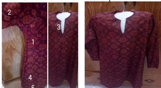
Gambar 2. Baju Kurung Perempuan Melayu Jambi

Pada baju kurung melayu Jambi memiliki banyak makna nilai filosofi yang melekat, seperti yang dikemukakan oleh Nurlaini (2017), baju kurung yang melekat pada perempuan melayu Jambi memiliki banyak nilai-nilai filosofis mulai dari atas sampai kebawah.