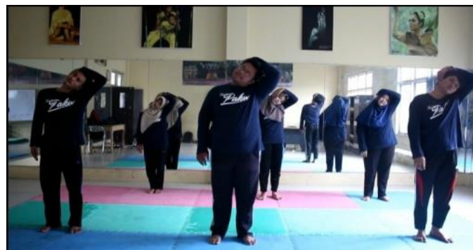
Gambar 3. Contoh pemanasan

Pengembangan e-book mata kuliah Drama lalu dilanjutkan dengan memilih potongan-potongan gambar apa saja yang dianggap sesuai untuk melengkapi instruksi-instruksi gerakan olah vokal dan tubuh dalam buku. gambar-gambar tersebut harus mampu membantu memperjelas dan mempermudah pembaca dalam memahami dan mencontoh gerakan. Berikut beberapa potongan gambar yang digunakan dalam e-book mata kuliah Drama.