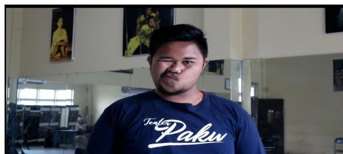
Gambar 4. senam wajah

Tahap pengembangan kemudian diikuti dengan penyusunan soal evaluasi tiap akhir bab. Setelah semua aspek pengembangan e-book mata kuliah Drama selesai, e-book dinilai dan divalidasi oleh seorang validator yang merupakan ahli di bidang media dan pembelajaran