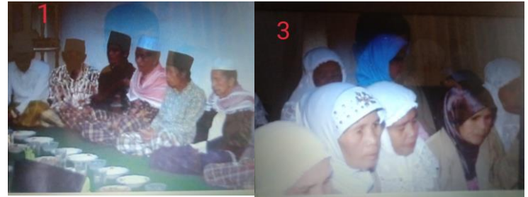
Keterangan: kegiatan butale dilaksanakan sebelum menjalankan ibadah haji.

Butale merupakan sebagai bagian dari proses pelepasan anggota masyarakat atau anggota keluarga yang akan melaksanakan ibadah haji. Butale merupakan sebuah lantunan yang berisi doa-doa atau harapan kepada anggota masyarakat atau anggota keluarga yang akan melaksanakan ibadah haji. Dalam tradisi butale ini adanya terkandung suatu nilai-nilai yang terdapat dalam tradisi butale ini yakni nilai keagamaan, nilai kekeluargaan, nilai kebersamaan.