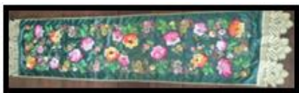
Gambar 2. Selendang Kebesaran dengan Warna Khas dasar hitam