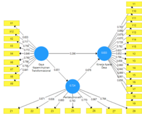
Gambar 2 Model Pengujian Factor Loading

Hasil pengujian reliabilitas diketahui bahwa semua variabel reliabel karena memenuhi kriteria dari Penilaian Composite Reliability yaitu memiliki nilai diatas 0,7. Dimana variabel Gaya kepemimpinan transformasional, Kinerja aparat desa, Perilaku Inovatif memiliki nilai diatas 0,7 artinya reliabel dan valid, sehingga semua penilaian telah memenuhi estimasi dalam penilaian outer model. Sedangkan Gambar 2 hasil penelitian disimpulkan bahwa seluruh indikator telah memiliki nilai loading factor diatas 0,50. Hal ini berarti indikator yang digunakan dalam penelitian ini sudah memenuhi kriteria dari factor loading sehingga data tersebut akan digunakan sebagai data primer yang akan diolah untuk langkah berikutnya.