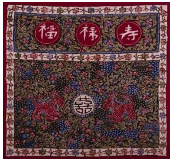
Gambar 1 Motif Batik Jlamprang