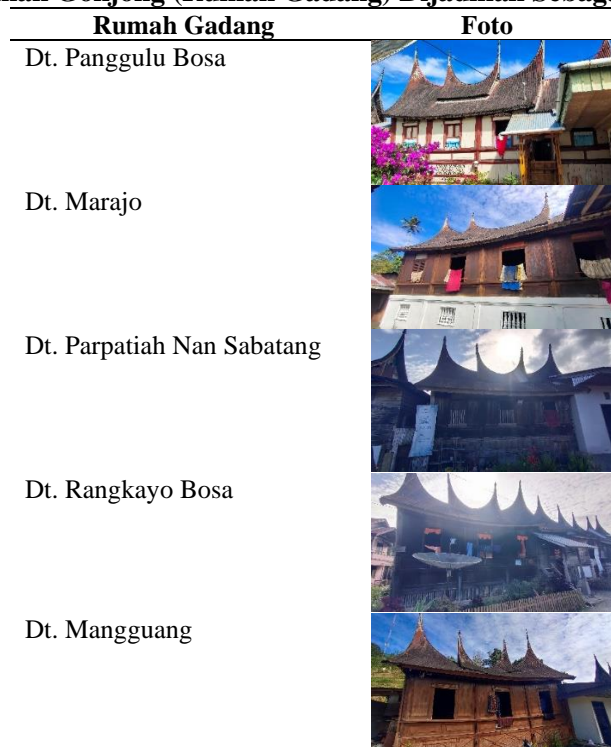
Tabel 4 Daftar Rumah Gadang (Rumah Gadang) Dijadikan Sebagai Homestay

Terpopuler. Pengakuan ini tidak hanya meningkatkan profil Kampung Sarugo di kancah nasional, tetapi juga menarik lebih banyak wisatawan untuk berwisata ke Kampung Sarugo (Aprilia & Muzan, 2023). Setelah mendapatkan penghargaan ini, Kampung Sarugo semakin banyak didatangi oleh wisatawan. Homestay-homestay juga meningkatkan pelayanan termasuk menyediakan buku tamu yang berkunjung ke homestay.