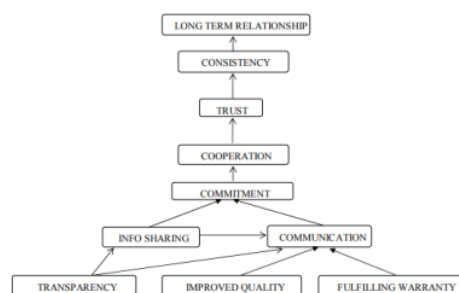
Gambar 2. Buyer satisfaction ISM model (Gupta & Tripathi 2018)

Namun model ini tidak serta merta dapat menjadi kerangka model kepuasan pembeli dalam pengadaan secara elektronik. Sebagaimana diungkap oleh Mates, Lechner, Rieger, & Pěkná, (2013), kegagalan dalam e-procurement dikarenakan adanya kesenjangan antara kebiasaan realita lokal dengan desain sistem yang dibuat oleh pemerintah. Kesenjangan ini bisa meliputi kesenjangan persepsi, kesenjangan kemanfaatan, dan kepercayaan dari penyedia barang/jasa ke pemerintah maupun sebaliknya. Inilah rumusan masalah yang ingin dijawab dalam penelitian ini.